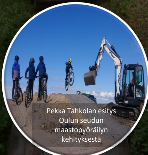
Pekka Tahkolan esitys Oulun seudun maastopyöräilyn kehityksestä