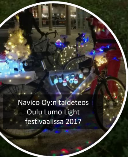
Navico Oy:n taideteos Oulu Lumo Light festivaalissa 2017